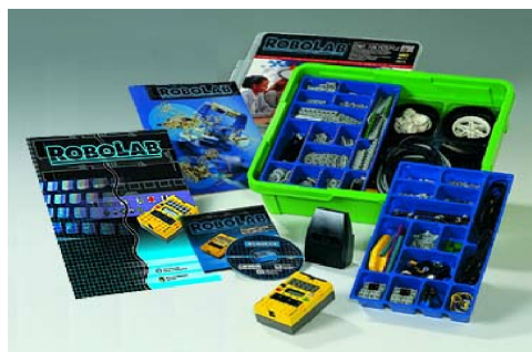
ROBOLAB チームチャレンジセット