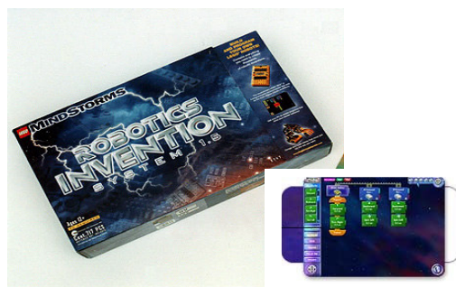
玩具系列 Robotics Invention Systems (RIS)